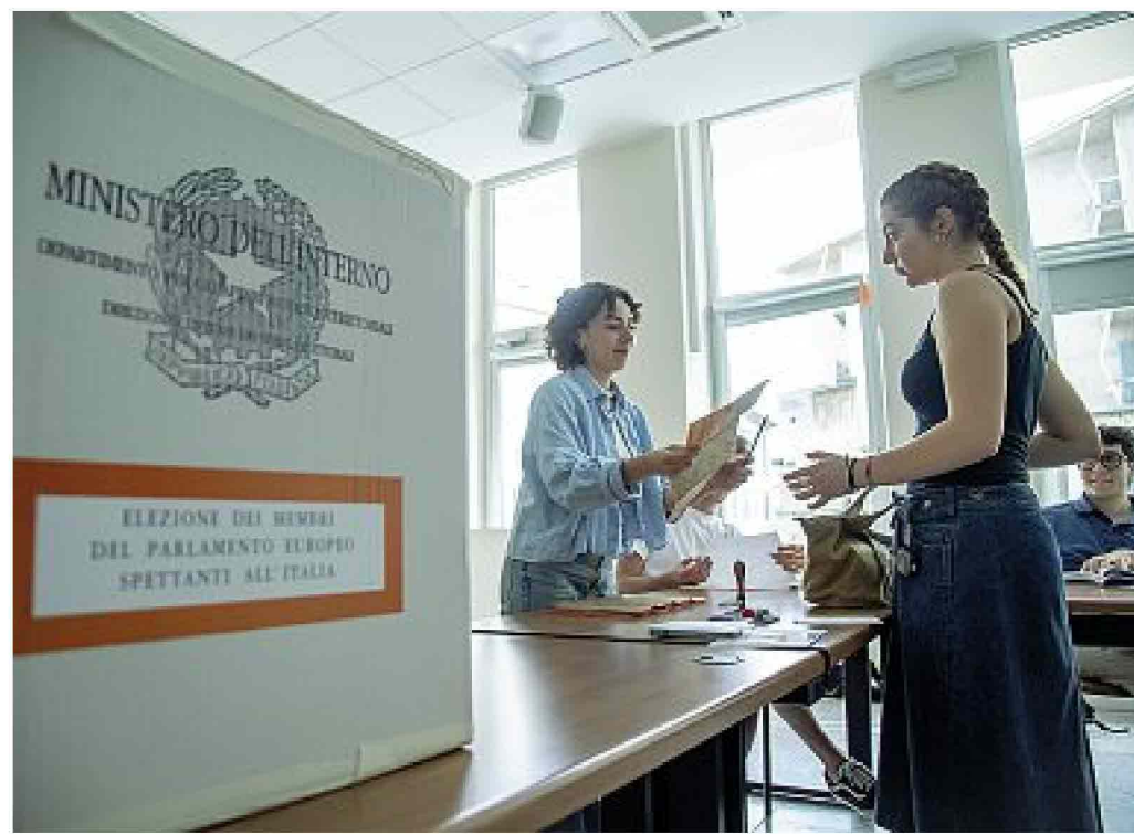
La novità Il seggio elettorale in Università Cattolica per permettere ai fuorisede di votare